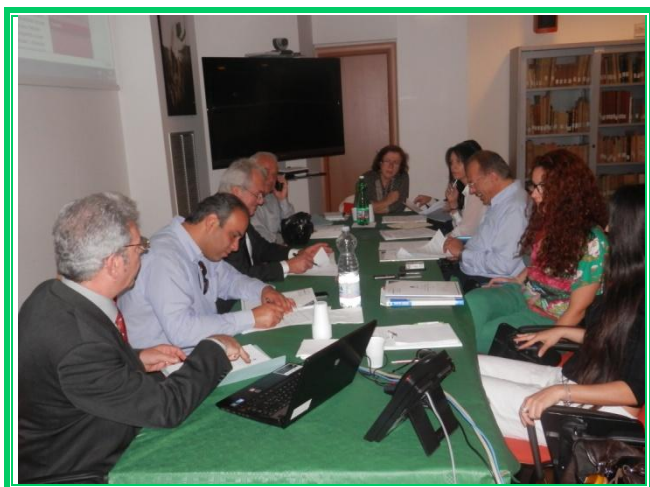
Roma 7 giugno 2013

Si è svolto a Roma (RM) il giorno 7 giugno 2013, presso l’Istituto Nazionale di Economia Agraria (INEA), il coordinamento della cooperazione transnazionale del Progetto“ Rete itinerari Gastronomici e Cultura del Gusto ”. Il progetto coinvolge territori rurali della Calabria, Molise, Puglia e altri territori di Portogallo, Cipro e Grecia. Tema dell’incontro: attività operative in vista della conclusione della programmazione 2007/2013. Il fine progettuale è rappresentato dalla promozione delle specificità locali e la valorizzazione delle identità territoriali, nell’interesse alla cooperazione tra territori così diversi ma così vicini in quanto a potenzialità e problematiche. ( LEGGI TUTTO )