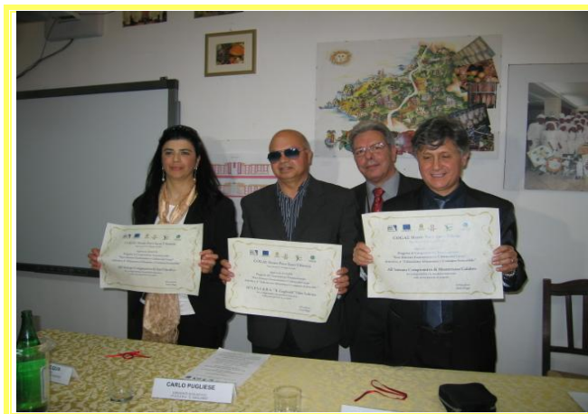
I.P.S.A.A.R.A. Istituto Alberghiero Vibo Valentia

Si sono concluse con il convegno “ La corretta alimentazione dei giovani e la gastronomia locale ” tenutosi il 4 giugno presso l’Istituto Alberghiero di Vibo Valentia, le iniziative di carattere didattico ed informativo che hanno coinvolto le ultime due classi della scuola primaria della provincia di Vibo aderenti al Progetto di Cooperazione Transnazionale “ Rete Itinerari Gastronomici e cultura del Gusto ”- Attività 4 “ Educazione Alimentare ed al Consumo sostenibile ” - Approccio Leader – Regione Calabria. L’incontro ha rappresentato l’occasione da parte di dirigenti e del Presidente del Cogal per consegnare gli attestati di partecipazione al progetto a tutti quei bambini che nel corso del biennio 2011/2013 hanno seguito il percorso di educazione alla corretta alimentazione legata alla gastronomia locale. ( LEGGI TUTTO )